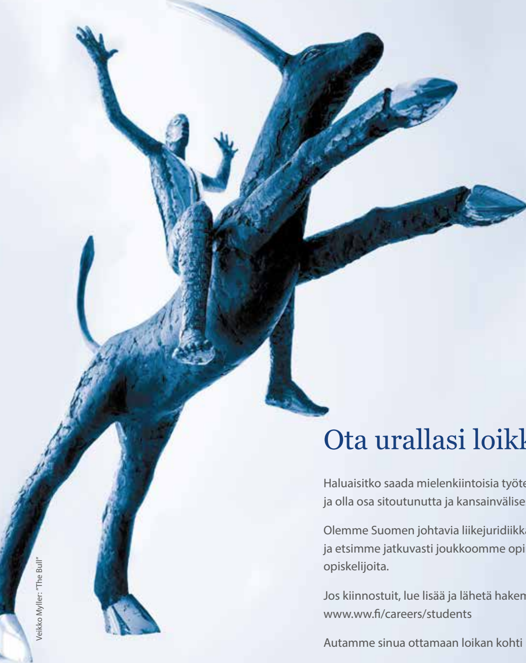
Veikko Myller: "The Bull"